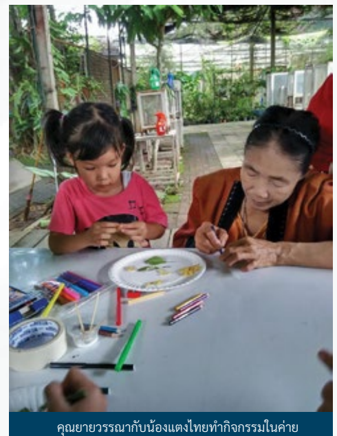
คุณยายวรรณกับน้องแตงไทยทำกิจกรรมในค่าย