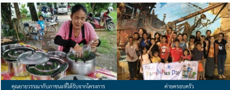
คุณยายวรรณกับภาชนะที่ได้รับจากโครงการ