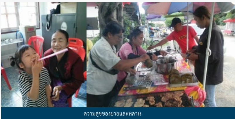
ความสุขของยายและหลาน

“I’d like to thank all sponsors for helping us so I can earn more income. Even we do not have many friends or relatives to help us, we have the Operation Blessing foundation (Thai) alongside us. May you all have a happy and prosperous life.”